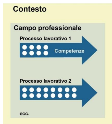
Figura 2: Struttura del profilo professionale

Il presente programma quadro si basa sulla struttura rappresentata nella figura seguente.